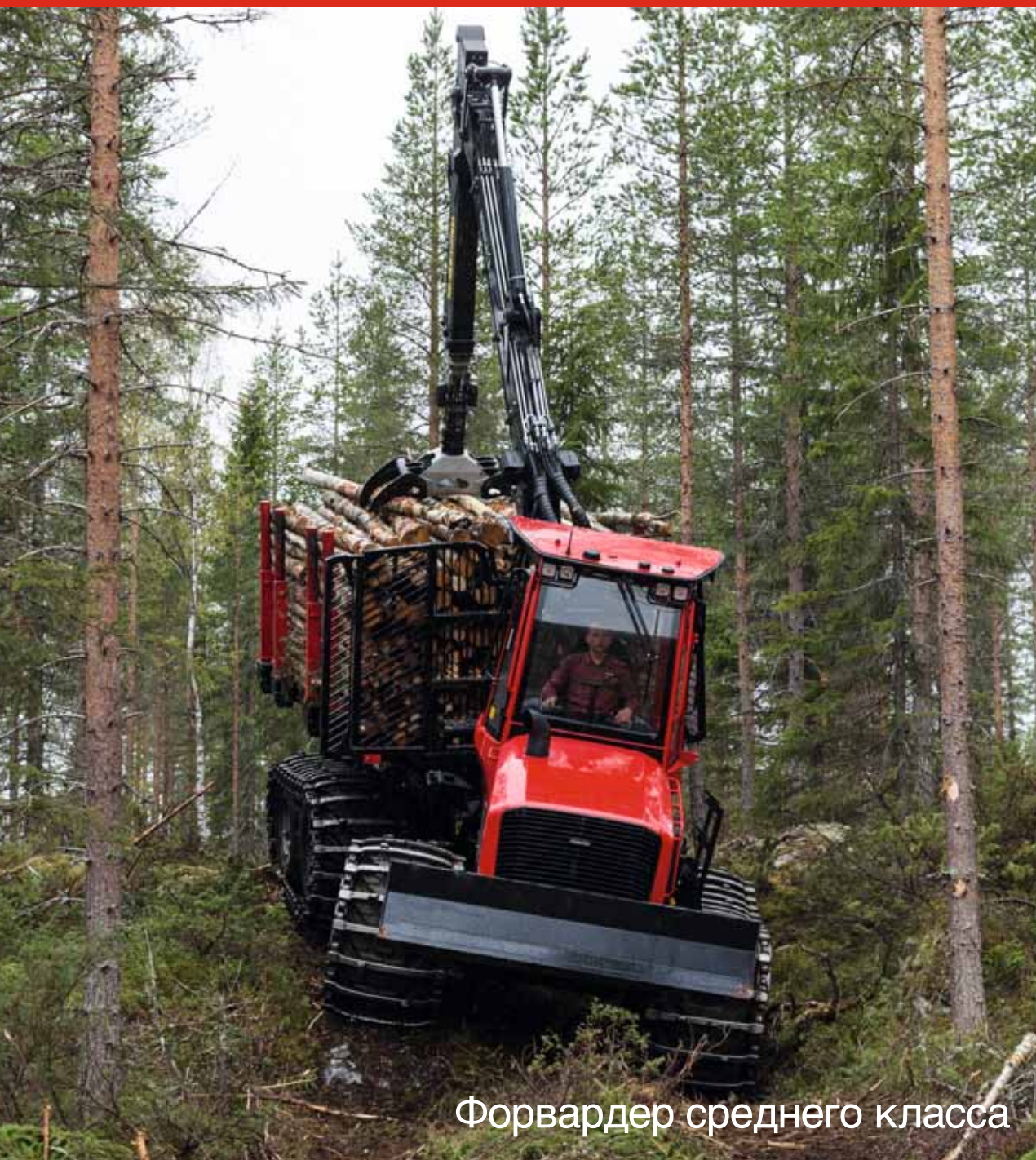
Форвардер среднего класса